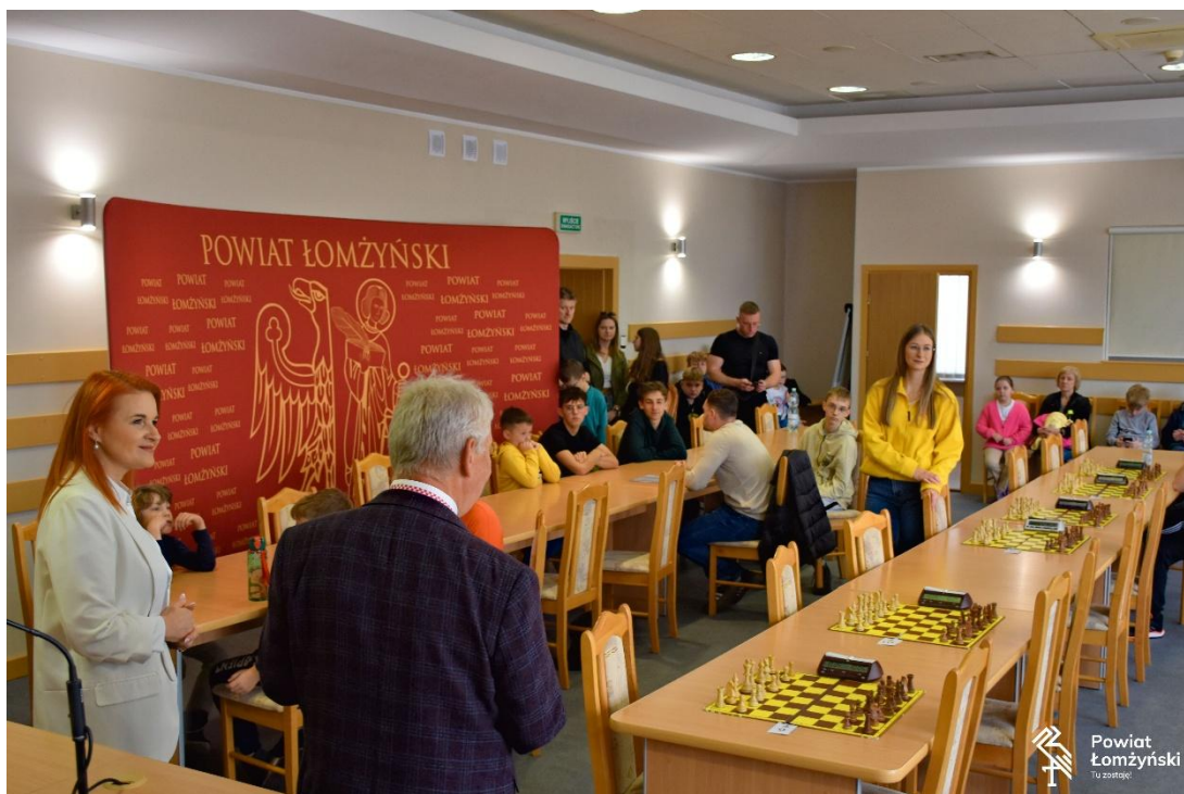
Ilustracja 16; Źródło: https://powiatlomzynski.pl/index.php?wiad=4937

Szachy, tenis stołowy, piłka nożna, badminton, tenis ziemny czy zyskujące na popularności strzelectwo to tylko niektóre z dyscyplin, które znalazły się w kalendarzu zawodów sportowych zorganizowanych przez lokalny LZS. Tak szeroki wachlarz aktywności pozwolił na zaangażowanie w sportową rywalizację ponad 250 mieszkańców regionu, niezależnie od ich wieku czy doświadczenia. Realizacja przedsięwzięcia przyczyniła się do popularyzacji aktywności fizycznej wśród społeczności powiatu, wzmacniała nawyki prozdrowotne oraz budowała świadomość znaczenia regularnego ruchu. Dzięki różnorodności dyscyplin zadanie objęło szeroką grupę odbiorców, a sport stał się naturalnym elementem codzienności uczestników.