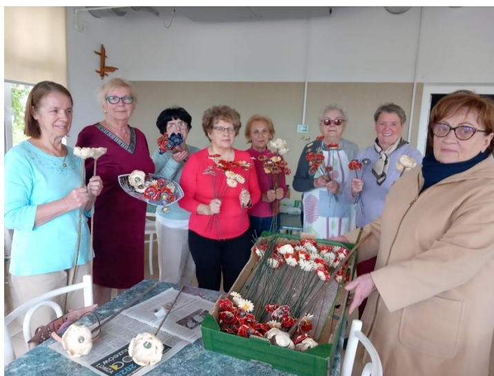
Ilustracja 4