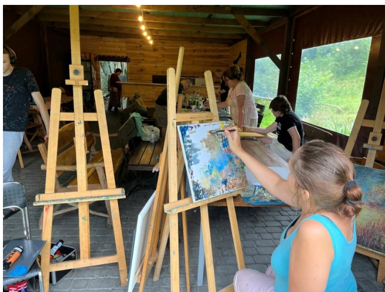
Ilustracja 17

Po raz XI naturalne piękno Powiatu łomżyńskiego uchwycili artyści-amatorzy podczas kolejnej edycji Pleneru Malarskiego – wydarzenia, które od lat przyciąga stałe grono malarzy spragnionych twórczych doznań. Ubiegłoroczny plener ponownie stał się okazją do kreatywnego obcowania z lokalnym krajobrazem, a jednocześnie formą promocji walorów turystycznych regionu. Uczestnicy pracowali w otoczeniu charakterystycznych dla powiatu pejzaży, czerpiąc inspirację z natury, historii i wyjątkowej atmosfery miejsca. Zwieńczeniem przedsięwzięcia był wernisaż prezentujący prace powstałe podczas pleneru – namacalny dowód na atrakcyjność regionu jako przestrzeni sprzyjającej zarówno twórczości, jak i wypoczynkowi.