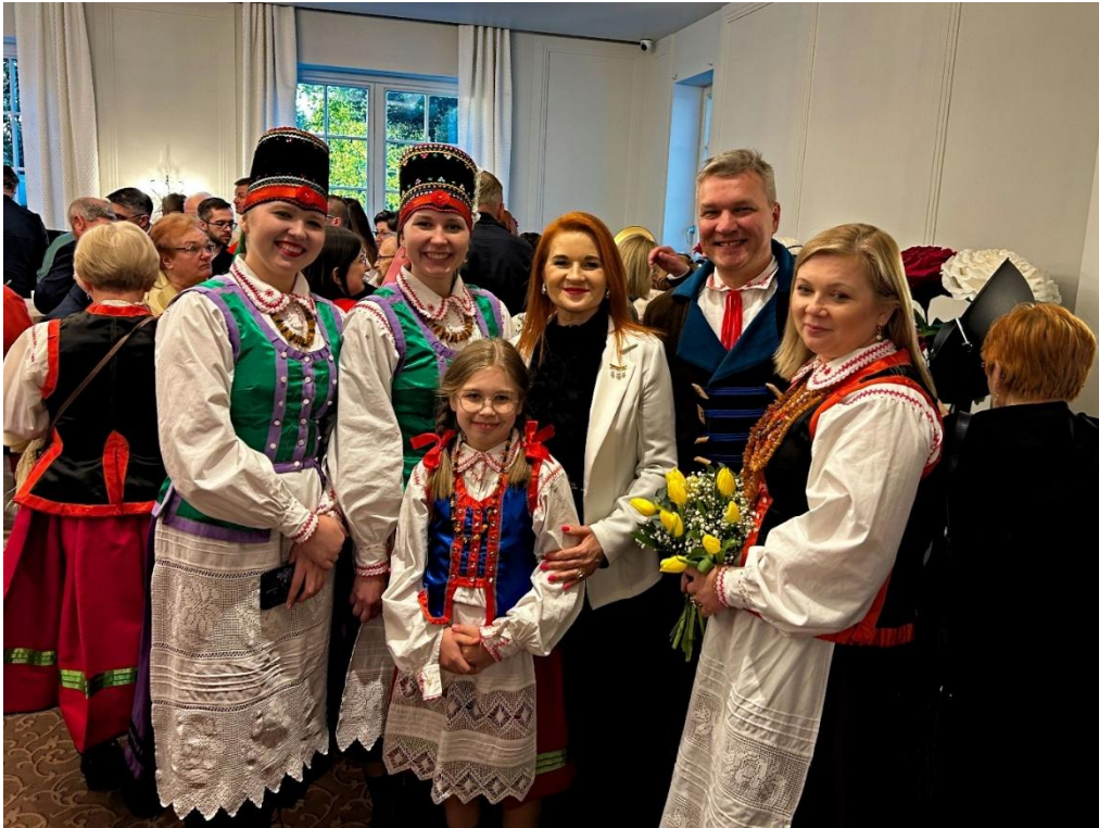
Ilustracja 21; Źródło: https://powiatlomzynski.pl/index.php?wiad=4914

VI edycja konkursu wiedzy „Solidarność – droga do wolności”, Komisja Międzyzakładowa Pracowników Oświaty i Wychowania NSZZ „Solidarność” w Łomży