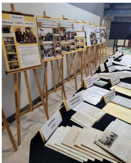
Ilustracja 3

Zadanie TUL-u miało na celu przede wszystkim aktywizację osób starszych i zwiększenie ich zaangażowania w życie społeczne oraz szeroko pojęty rozwój i edukację seniorów bez względu na ich zaawansowany wiek. Efekty te osiągnięto poprzez bogatą ofertę kulturalno-zajęciową, na którą złożyły się m.in. 5 wykładów dotyczących historii i kultury Ziemi Łomżyńskiej, warsztaty i wystawy ceramiczne, wycieczki edukacyjnej. Wymienione działania znalazły szerokie grono odbiorców liczące ok. 50 osób.