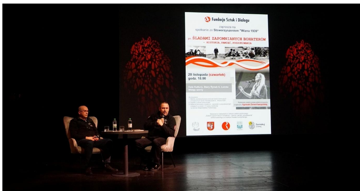
Ilustracja 12