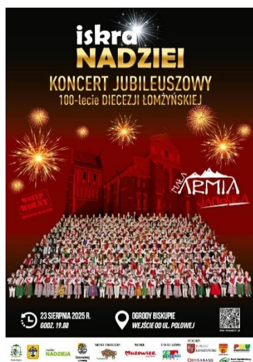
Ilustracja 9

Jubileusz 100-lecia Diecezji Łomżyńskiej był na wielu płaszczyznach jednym z kluczowych wydarzeń jakie miały miejsce w roku 2025, a zorganizowany przez Fundację koncert muzyczny o charakterze patriotyczno-religijnym podkreślił rangę tej wyjątkowej rocznicy. Widowisko cieszyło się dużym zainteresowaniem, przyciągając publiczność zarówno z jak i spoza regionu. Istotnym aspektem przedsięwzięcia było również przybliżenie historii Diecezji Łomżyńskiej i upowszechnianie wiedzy o jej dziedzictwie, co znacząco przyczyniło się do promocji rodzimej kultury na arenie ponadlokalnej.