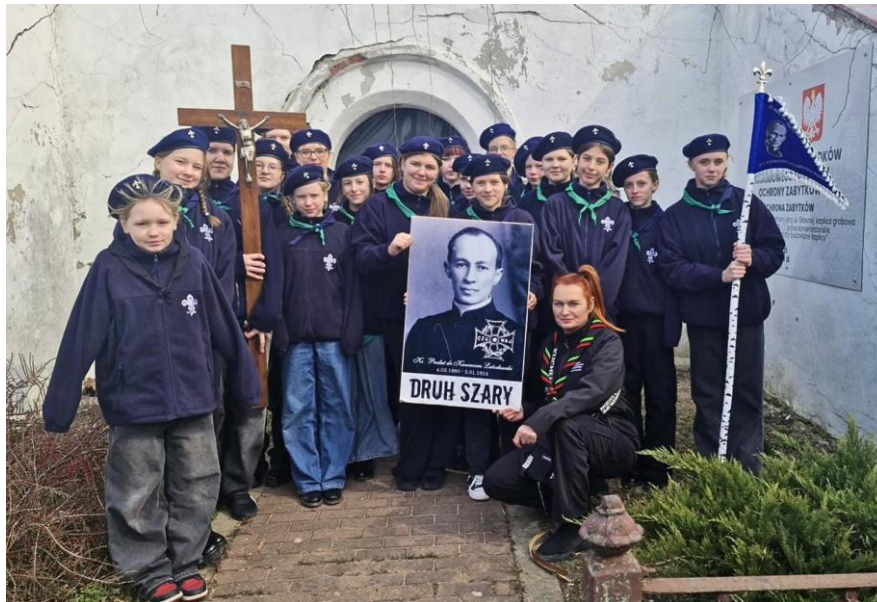
Ilustracja 20; Źródło:

https://www.facebook.com/photo/?fbid=1065589035597882&set=pcb.10655890622645