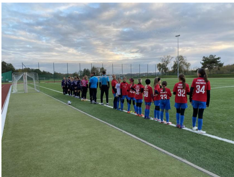
Ilustracja 15; Źródło:

GKS FORTY PIĄTNICA – jako ośrodek piłkarskiego życia tamtejszej gminy i na kanwie ww. zadania, za cel obrał popularyzację aktywności fizycznej wśród dzieci i młodzieży oraz promowanie zdrowego stylu życia poprzez regularne uczestnictwo w zajęciach sportowych. Regularne zajęcia oraz możliwość udziału zawodniczek w rozgrywkach ligowych wzmacniały integrację młodych sportowców, uczyły współpracy i zachęcały do aktywnego spędzania czasu wolnego. Realizacja zadania przyczyniła się również do kształtowania wśród uczestników pozytywnych postaw i cech charakteru – takich jak sumienność, punktualność, odpowiedzialność czy umiejętność pracy w grupie – które stanowią trwałe fundament ich dalszego rozwoju, zarówno sportowego, jak i osobistego.