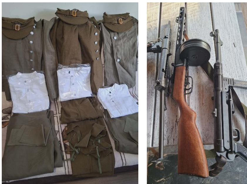
Ilustracja 5; Źródło: Stowarzyszenie Miłośników Ziemi Jedwabieńskiej

Ideą stojącą za realizacją zadania było trwałe upamiętnienie historii Żołnierzy Niezłomnych oraz wzmocnienie lokalnej tożsamości historycznej mieszkańców gminy Jedwabne i powiatu łomżyńskiego. Pomysł ten znalazł swoje urzeczywistnienie poprzez wykonanie trzech rekonstrukcji historycznych umundurowania i wyposażenia bojowego żołnierzy Narodowych Sił Zbrojnych i Armii Krajowej – te udostępnione są dla zwiedzających w Izbie Pamięci Gminy Jedwabne. Stowarzyszenie zorganizowało także wystawę poświęconą Żołnierzom Wyklętym oraz dwie prelekcje historyczne dotyczące powojennej konspiracji antykomunistycznej i bojowego wysiłku Niezłomnych. Zadanie znacząco przyczyniło się do budowania lokalnej tożsamości i edukacji historycznej – zwłaszcza wśród młodego pokolenia.