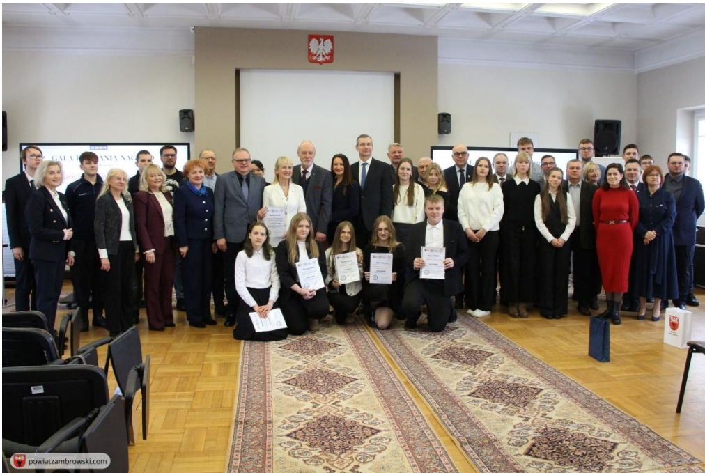
Ilustracja 22; Źródło: https://powiatlomzynski.pl/index.php?wiad=5136

VI edycja konkursu wiedzy „Solidarność – droga do wolności”, Komisja Międzyzakładowa Pracowników Oświaty i Wychowania NSZZ „Solidarność” w Łomży