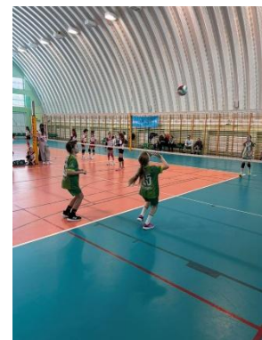
Ilustracja 13