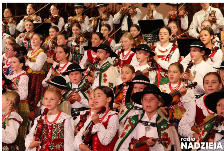
Ilustracja 8; Źródła: https://radionadzieja.pl/wiara-iskra-nadziei-koncert-jubileuszowy-100-lecie-diecezji-lomzynskiej-za-nami/