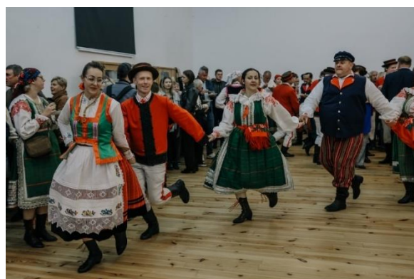
Ilustracja 10; Źródło: Fundacja Akademia Źródeł