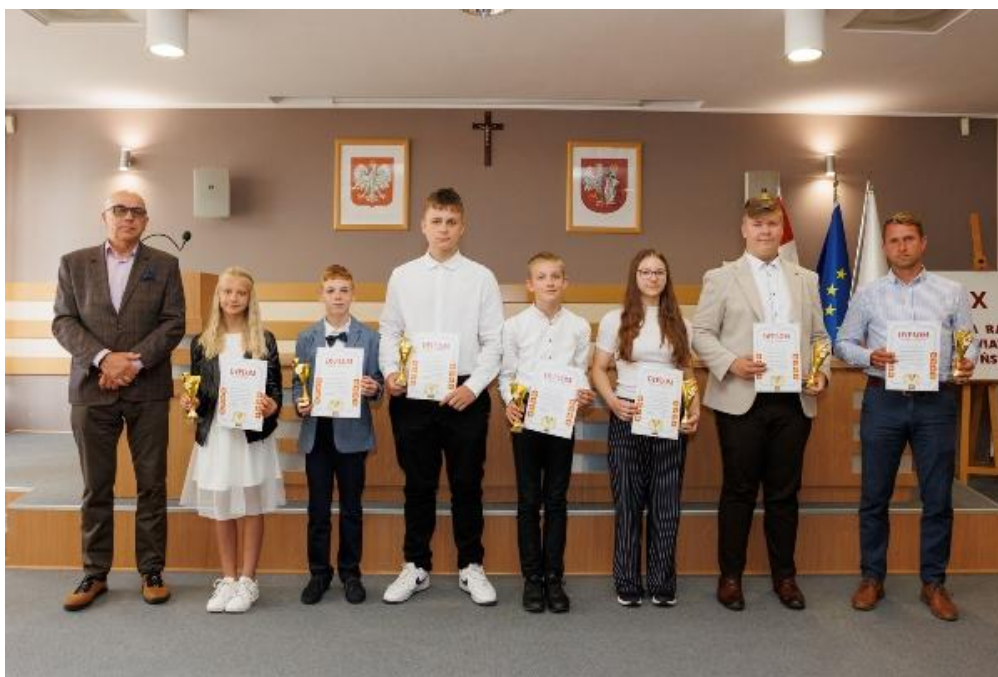
Ilustracja 14; Źródło: https://powiatlomzynski.pl/bip/index.php?wiad=12508

5 520 uczestników reprezentujących 27 szkół z terenu powiatu i 60 imprez sportowych to policzalne efekty, jakie osiągnął PSZS realizując ww. zadanie. Jego głównym celem była popularyzacja aktywności fizycznej wśród dzieci i młodzieży szkolnej oraz kształtowanie postaw sprzyjających zdrowemu stylowi życia i aktywnemu spędzaniu czasu wolnego. W ramach przedsięwzięcia zorganizowano cykl zawodów obejmujących najpopularniejsze dyscypliny sportowe uprawiane w regionie, zapewniając szerokie możliwości udziału uczniom z różnych szkół. Realizacja zadania przyczyniła się do wzrostu zainteresowania sportem wśród młodych mieszkańców powiatu, a także do podniesienia świadomości na temat znaczenia aktywności fizycznej dla zdrowia. Namacalnym efektem działań są liczne sukcesy zawodników i zawodniczek z powiatu łomżyńskiego, zdobywane podczas rywalizacji sportowej na różnych szczeblach – od lokalnego po międzynarodowy.