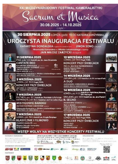
Ilustracja 1