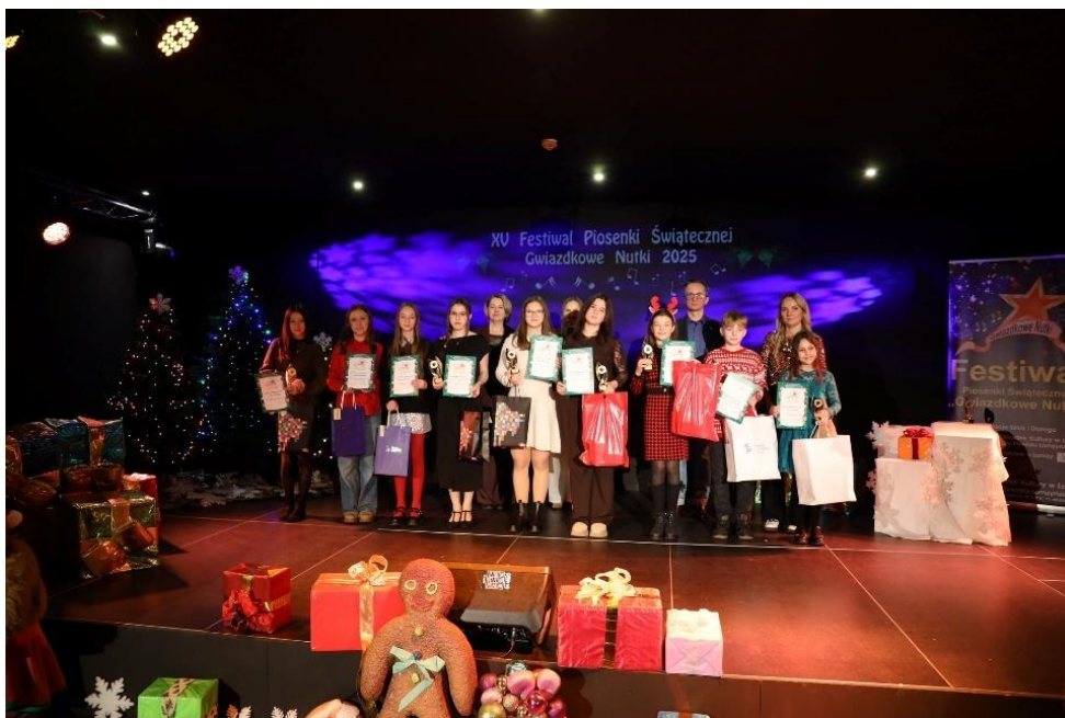
Ilustracja 11; Źródło: https://powiatlomzynski.pl/index.php?wiad=5103

Zadanie miało na celu integrację dzieci i młodzieży z różnych środowisk poprzez wspólne uczestnictwo w kulturze oraz rozwijanie zainteresowań muzycznych. Ważnym elementem przedsięwzięcia było również kształtowanie pozytywnych wzorców spędzania czasu wolnego poprzez angażowanie młodych ludzi w wartościowe formy aktywności artystycznej. W ramach zadania zrealizowano dwa festiwale tematyczne: XXXIII Giełdę Piosenki Dziecięcej i Młodzieżowej „Scena Młodych Wokalistów” oraz XV Festiwal Piosenki Świątecznej „Gwiazdkowe Nutki”. Wydarzenia – o długiej tradycji i na stałe wpisane w kalendarz kulturalny regionu, stworzyły uczestnikom możliwość zaprezentowania umiejętności wokalnych oraz wymiany doświadczeń artystycznych. Łącznie w obu imprezach wzięło udział 101 młodych wykonawców, co stanowi rekord frekwencyjny i potwierdza duże zainteresowanie tego typu inicjatywami wśród młodych mieszkańców Ziemi Łomżyńskiej.