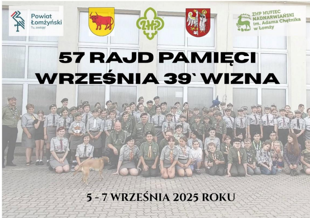
Ilustracja 19; Źródło:

https://www.facebook.com/photo?fbid=1043224741359965&set=a.389363896746056