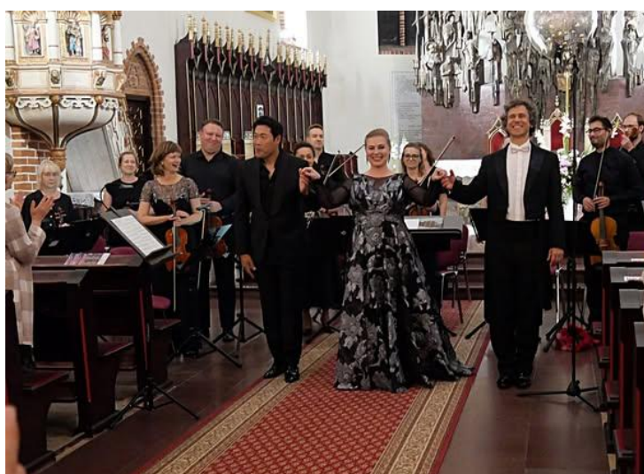
Ilustracja 2; Źródło:

https://filharmonia.lomza.pl/sacrum-et-musica-2025/